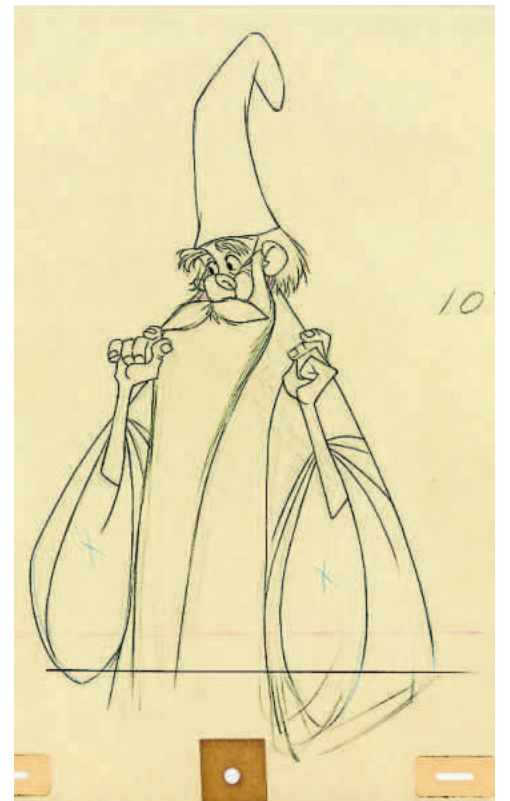
Merlijn de Tovenaar, 1963.

Daarna volgt een van de meest gedenkwaardige films uit de keuken van Disney: Fantasia . De expositie zoomt in op De Pastorale , een van de acht onderdelen waaruit de film