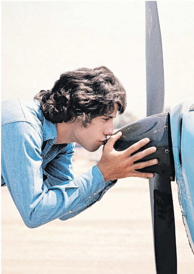
John Travolta was in 1975 nog een vrij onbekende acteur toen hij werd geportretteerd terwijl hij een vliegtuigpropeller kust.