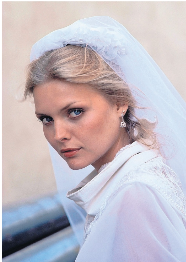
Michelle Pfeiffer, gefotografeerd tijdens de opnamen van de film 'Charlie Chan and the Curse of the Dragon Queen'.