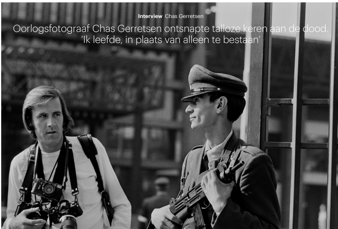
Chas Gerretsen aan het werk tijdens de staatsgreep in Chili, in 1973.

Oorlogsfotograaf Chas Gerretsen ontsnapte talloze keren aan de dood. 'Ik leefde, in plaats van alleen te bestaan'